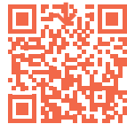
Illustration : Axel Serveaux

Réservez votre visite gratuite Boek uw gratis rondleiding